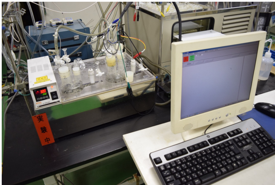
電気化学試験装置・解析装置