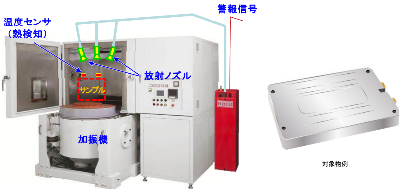
自動消火設備付振動試験機 イメージ図

当社の振動試験機に自動消火設備を導入したことにより、万が一発火した場合でも自動で消火することができるため、長時間無人で振動試験を実施することが可能です。