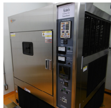
ブラックパネル温度83°C対応 サンシャインウェザーメーター