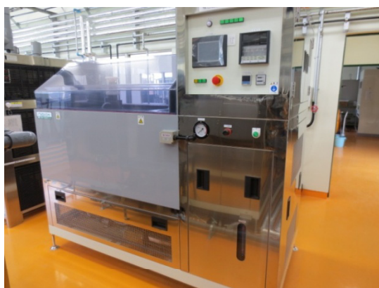
酸性溶液可能な複合サイクル試験機